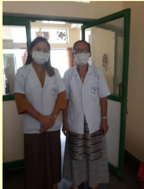
Een verpleegster en arts

De medische kliniek is gelegen te midden van de Tibetaanse nederzetting in Mundgod India aan de rand van het Ganden klooster. In de kliniek zijn zowel dorpelingen als kloosterlingen welkom. Indien een meer gespecialiseerde behandeling nodig is, worden mensen doorverwezen naar een groter ziekenhuis in Hubli of Bangalore. De behandeling in een gespecialiseerd ziekenhuis wordt voor 50% bekostigd uit het Zieke monniken fonds.