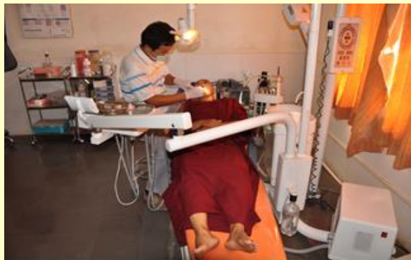
Ook kundige tandheelkundige zorg wordt verleend

Geshela en een paar vrienden van Stichting Dhonden zijn in december naar het klooster geweest (zie ook het activiteitenverslag). Zij waren zeer onder de indruk van de kliniek: de werkwijze is zeer professioneel en modern en grote aantallen mensen worden ondersteund. Vanwege de ziekte van één van hen moesten ze er zelf ook gebruik van maken, ze werden zeer vriendelijk en adequaat geholpen.